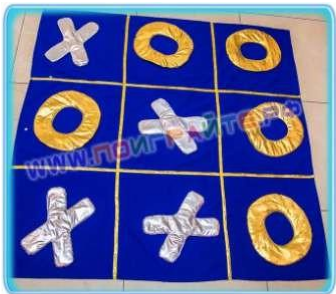
Таблица сшита из ткани либо условно обозначена. Для игры необходимы 5 ноликов и 5 крестиков. Две команды соревнуются по очереди осуществляя свой ход. Посobie объёмное и напольное.